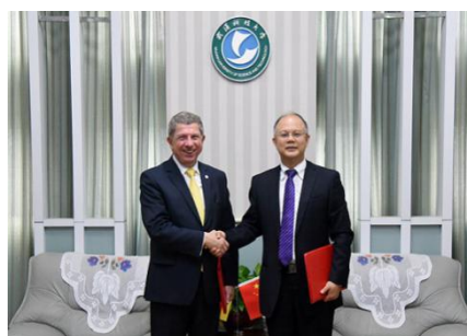
与德国弗莱贝格工业大学签署协议