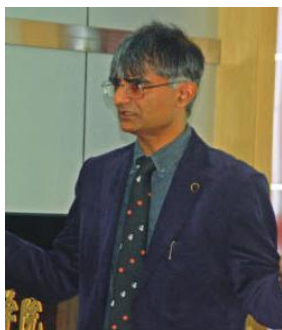
HKDH Bhadeshia 【英国剑桥大学】 武科大外专千人专家