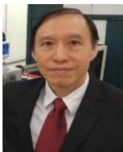
朱剑豪 【香港城市大学】 武科大特聘教授