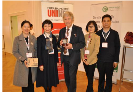
参加欧亚-太平洋大学联盟会议

遴选学生参加国际学术会议、国际学术夏令营以及国际竞赛。鼓励学生赴海外选修课程，资助学生进行海外项目实习、国际名校短期培训、国际知名企业参观和学习。