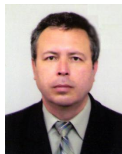
格瑞斯 【乌克兰第聂伯罗捷尔任斯克州立科技大学】 武科大外专千人专家