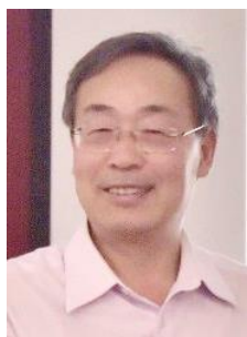
王国雄 【澳大利亚昆士兰大学】 武科大楚天学者讲座教授