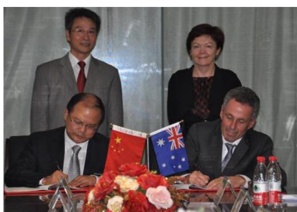
与澳大利亚迪肯大学签署协议

学校与德国弗莱贝格工业大学、奥地利莱奥本矿业大学、澳大利亚迪肯大学等国外高校签署国际化人才联合培养协议，加入欧亚-太平洋大学联盟，为材料类国际化英才班国际交流实践提供了保障。