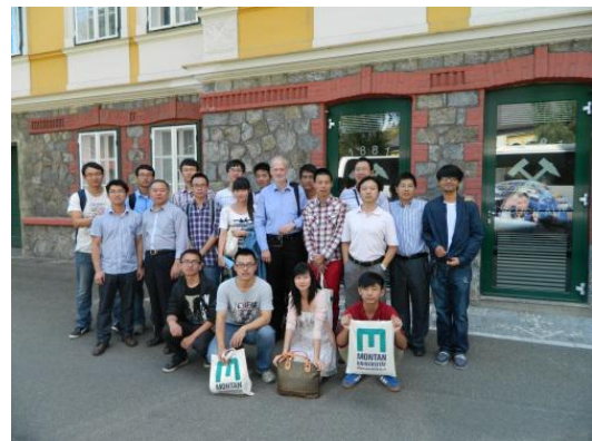
学院本科生赴奥地利莱奥本矿业大学交流